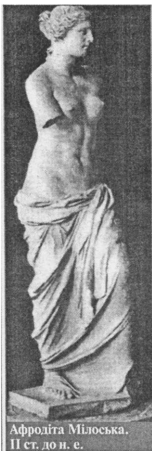
Афродіта Мілоська. III ст. до н. е.

— Я — Артеміда, дочка Зевса і Лето, Аполлонова сестра-близнючка, богиня мисливства, покровителька звірів. Зображують мене дівчиною в короткому хітоні, з луком і стрілами.